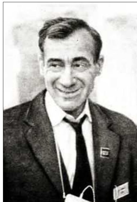
Ф.Д. Горбов (1967 год) [23]