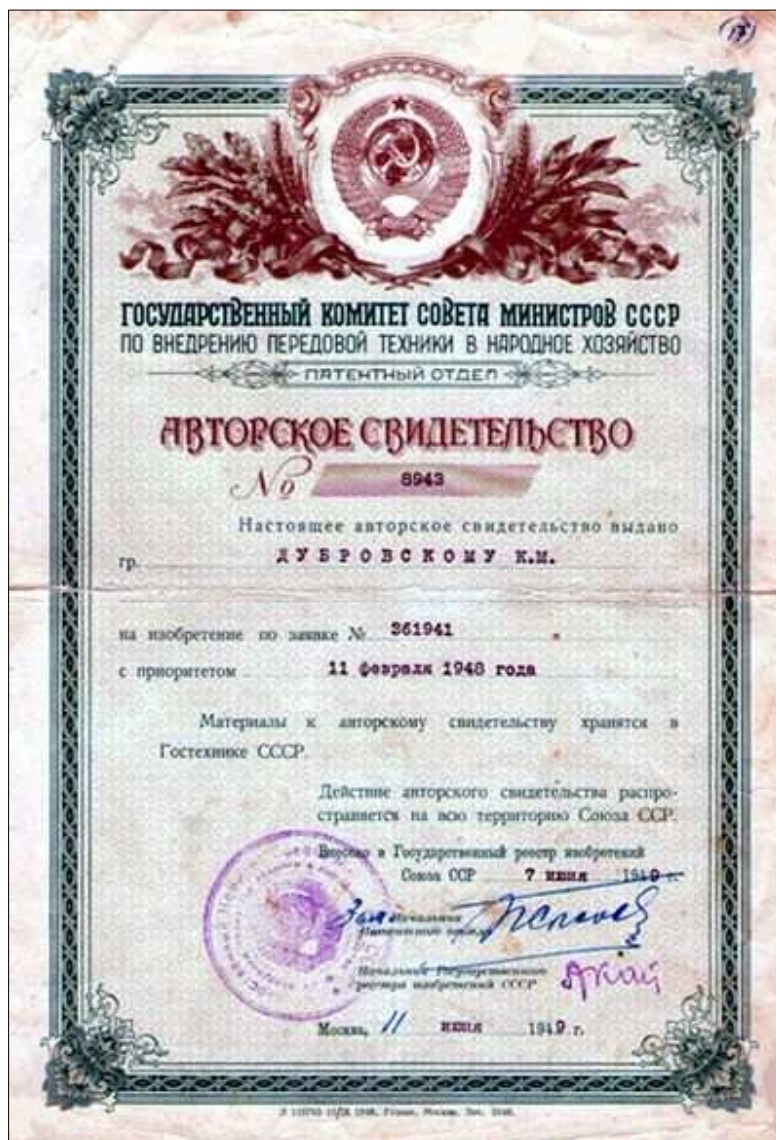
Авторское свидетельство № 8943 на изобретение по заявке № 361941 от 11.06.1949 г.