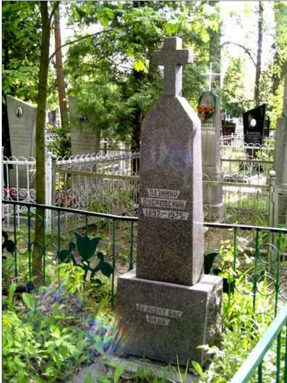
Могила К.М. Дубровского в г. Сарны