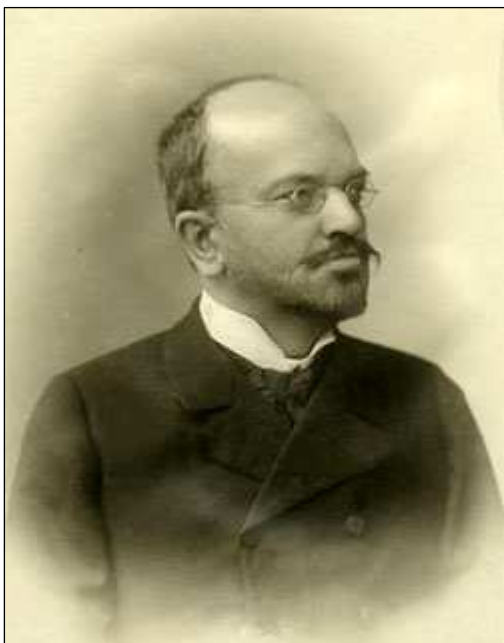
Владимир Федорович Чиж в молодости

В отличие от Фрейда, сосредоточившегося на научных исследованиях, Чиж успел получить большой практический врачебный опыт работы в военно-морском госпитале. Данный опыт позволил ему после возвращения в Петербург устроиться врачом в Тюремный госпиталь [17], что во многом предопределило его дальнейшую судьбу. Разница между внешним видом, мировоззрением и поведением матросов и заключенных поразили молодого врача, породив интерес всей жизни — изучение психологических причин делинквентного и криминального поведения. Злостное правонарушение Чиж считал следствием органического психического расстройства — «нравственной бесчувственности».