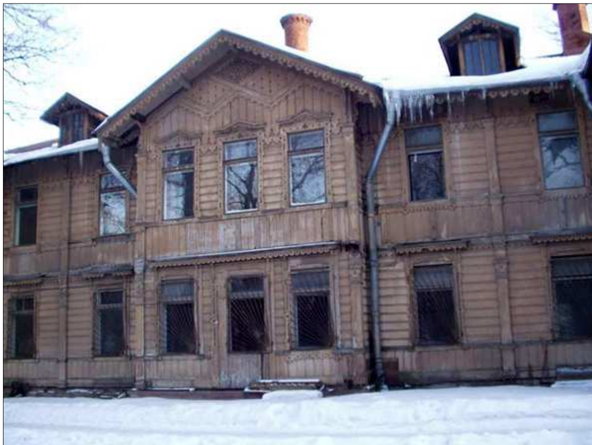
Корпус Петербургской городской больницы для душевнобольных во имя великомученика и целителя Пантелеймона, современное состояние

После возвращения в Россию Чиж начинает активно применять на практике полученные во время стажировки знания. Так, после назначения в 30 лет первым главным врачом Петербургской городской больницы для душевнобольных во имя великомученика и целителя Пантелеймона (600 коек) он добивается закупки в Германии необходимого оборудования и открывает психологическую лабораторию. Сейчас эта больница носит имя Скворцова-Степанова.