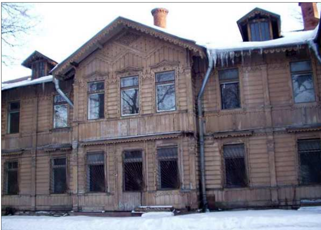
The building of the St. Petersburg city hospital for the mentally ill in the name of Great Martyr and Healer Panteleimon, the current state.